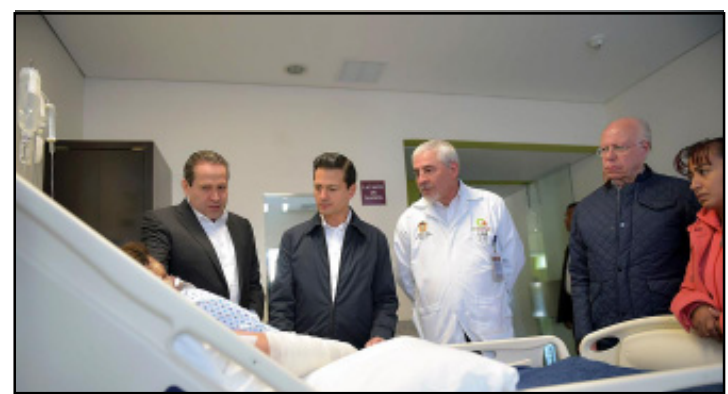
CIUDAD DE MEXICO.- El Mandatario señaló que el Estado de México está de luto por esta tragedia, que hasta el momento ha cobrado la vida de 35 personas.

En nombre propio y en nombre del Gobierno de la República, quiero nuevamente reiterar nuestra mayor solidaridad, particularmente para con las personas que han perdido un ser querido, para con las personas que resultaron lesionadas ante esta explosión registrada en Tultepec y para todos los mexiquenses que resienten este muy lamentable hecho», dijo.