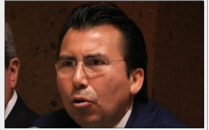
CIUDAD DE MEXICO.- A través del programa 'Diputada Amiga, Diputado Amigo' los legisladores han recibido más de 200 llamadas de migrantes mexicanos, 46% de ellas son quejas de extorsión.

Dio a conocer que solamente 67 de los 500 diputados federales participan en el programa que inició el 11 de diciembre de 2016.