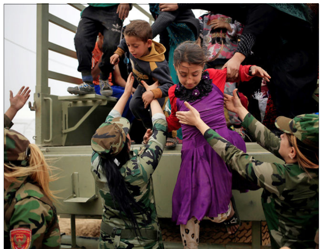
EL CAIRO.- Soldados peshmerga ayudan a unos niños desplazados de Mosul.

de niños por parte de grupos armados suníes y chiíes en Iraq, incluyendo algunas milicias que participan en la batalla para arrebatar la ciudad septentrional de Mosul de las manos del EI.