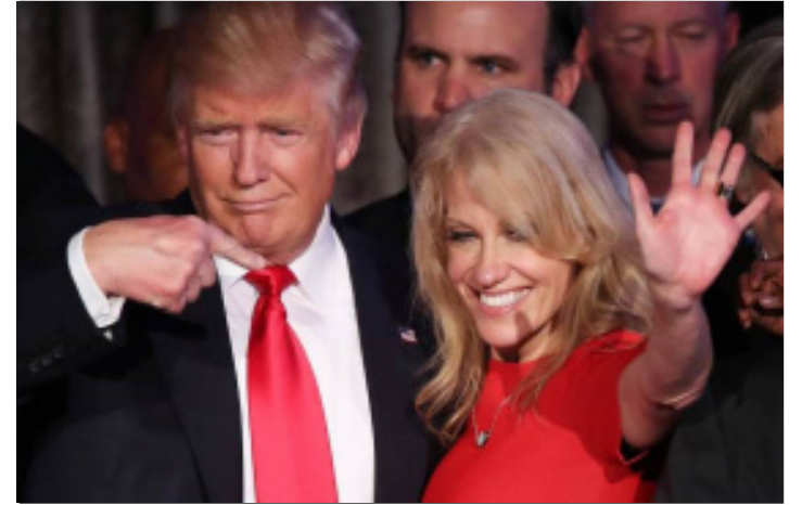
WASHINGTON.- La cara pública de la campaña de Donald Trump apoyará la ejecución de las prioridades legislativas de la presidencia del magnate neoyorquino.

La oficina de la transición del presidente electo de Estados Unidos, Donald Trump, eligió a Sean Spicer como secretario de