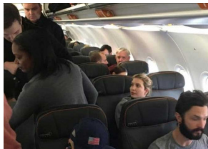
LOS ANGELES.- El sujeto fue expulsado del vuelo luego de gritar a la hija del presidente electo de Estados Unidos mientras ésta se disponía a viajar con sus hijos.

sidente electo de EU, Donald Trump, lo que llevó a la tripulación a expulsar a este pasajero del vuelo antes de que despegara del aeropuerto