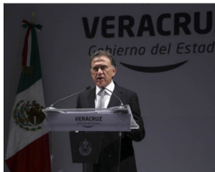
XALAPA.- El gobernador de Veracruz anunció que los vehículos tendrán un subsidio de ciento por ciento durante dos años; también condonará la de 2012 a 2015.

Este decreto elimina el Impuesto Sobre Tenencia o Uso de Vehículos y otros 20 conceptos impositivos, en beneficio de miles de familias coahuilenses, además de que para el año entrante no aumenta la carga tributaria ni se crean nuevos impuestos ni derechos que lo sustituyan.