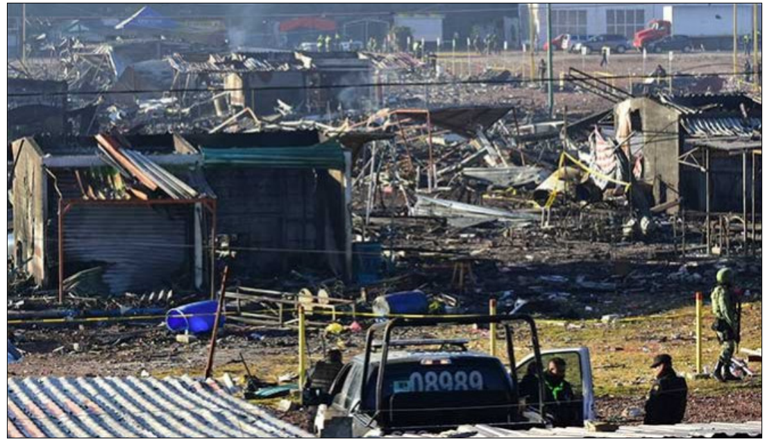
CIUDAD DE MEXICO.- Pese a la trágica explosión del martes, los comerciantes podrían trasladarse a La Saucera o a los 300 talleres de producción que están en los alrededores.

Portuguez Fuentes agregó que el gobierno municipal y estatal buscarán también la manera de apoyar, como ha ocurrido en otras ocasiones, a las personas afectadas en la explosión de este martes.