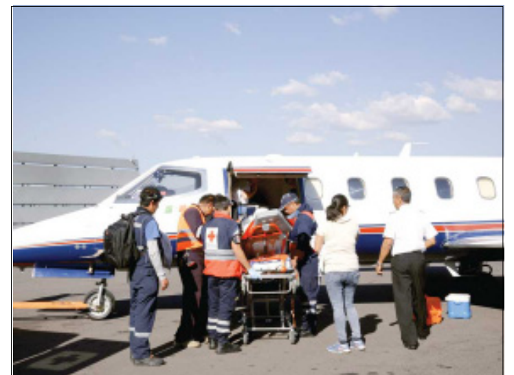
CIUDAD DE MEXICO.- Es el municipio mexiquense que presenta mayores emergencias por manejo de fuegos artificiales; ordena el presidente Peña Nieto dar a víctimas la atención médica necesaria.

El documento indica que 240 hogares del municipio se de-