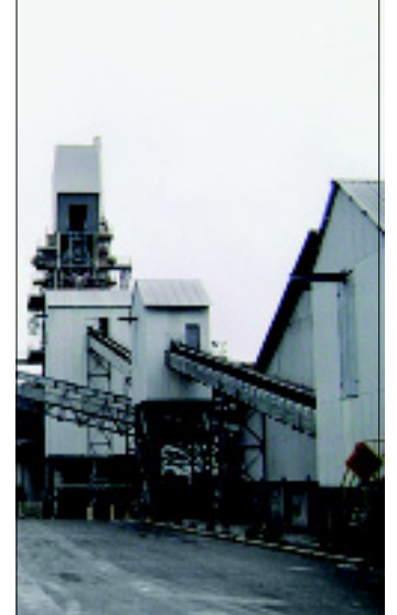
Su instalación en El Zacatón, generaría grave contaminación, advierte Grupo Ecológico Florida.

Dijo que esta planta puede generar mucha contaminación porque buscaran procesar más de 900 toneladas de cal al día, que abarcará un radio de más de 5 kilómetros, poniendo en riesgo la salud de todas las comunidades que la rodean como son los fraccionamientos y comunidades como Bosques de la