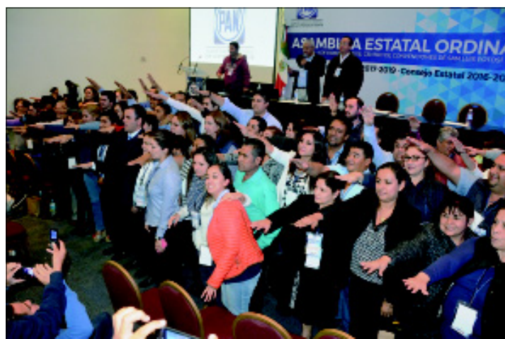
Acusan malas prácticas e inconsistencias que se han venido realizando en los últimos procesos internos del Partido Acción Nacional.