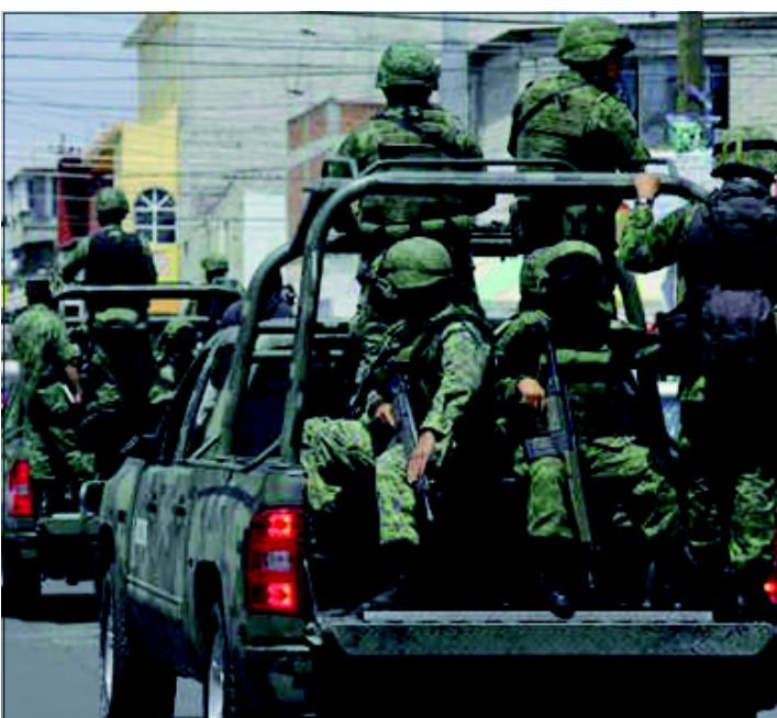
Se busca fortalecer la coordinación con el Ejército, cuyo despliegue en la Entidad, contribuye a las tareas de seguridad, destacó el Gobernador Juan Manuel Carreras.