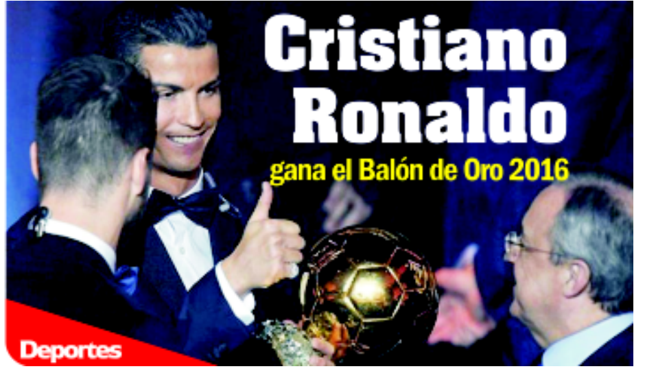
Cristiano Ronaldo gana el Balón de Oro 2016