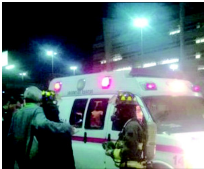
En un puesto de comida, en la calzada de Guadalupe se registró el flamazo; una persona fue trasladada para su atención al Hospital General de Soledad.

Agregó que el caso de la persona que fue trasladada se debió a que tenía quemaduras de segundo grado en el 15 por ciento del cuerpo, en zonas como la cara, manos y pecho, situación que reiteró se debió a una mala instalación del cilindro de gas y a que no cuentan con las medidas de prevención necesarias en los puestos. Salinas Saucedo dijo que en el caso de atenciones médicas hubo desde el domingo a las 8 de la mañana hasta el lunes a las 3 de la tarde fue de aproximadamente de 217 persona, y alrededor de mil 100 rehidrataciones que feligreses que cumplen sus mandas. Dijo que salvo al flamazo desde el 11 de diciembre por la noche hubo una situación