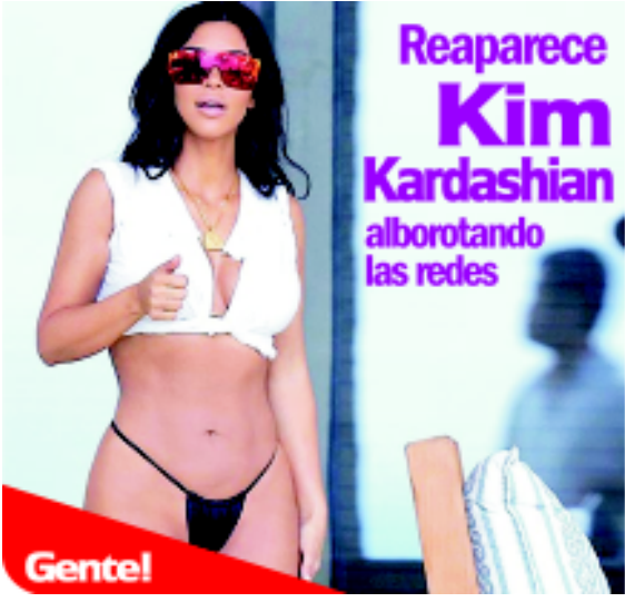
Reaparece Kim Kardashian alborotando las redes