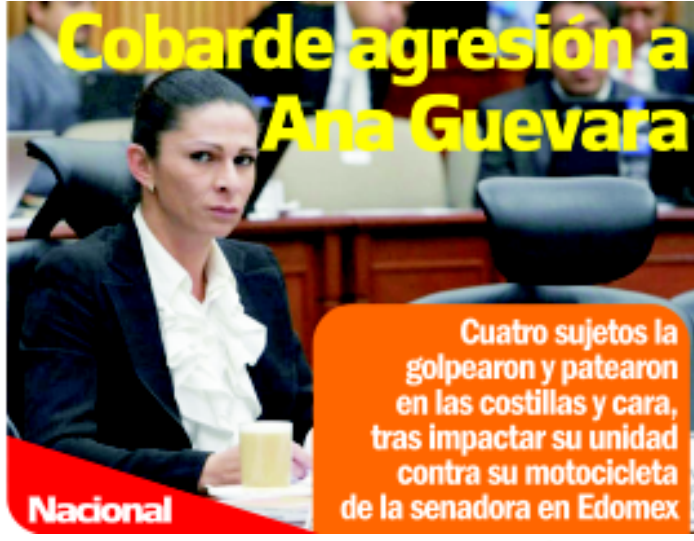
Cobarde agresión a Ana Guevara

Cuatro sujetos la golpearon y patearon en las costillas y cara, tras impactar su unidad contra su motocicleta de la senadora en Edomex