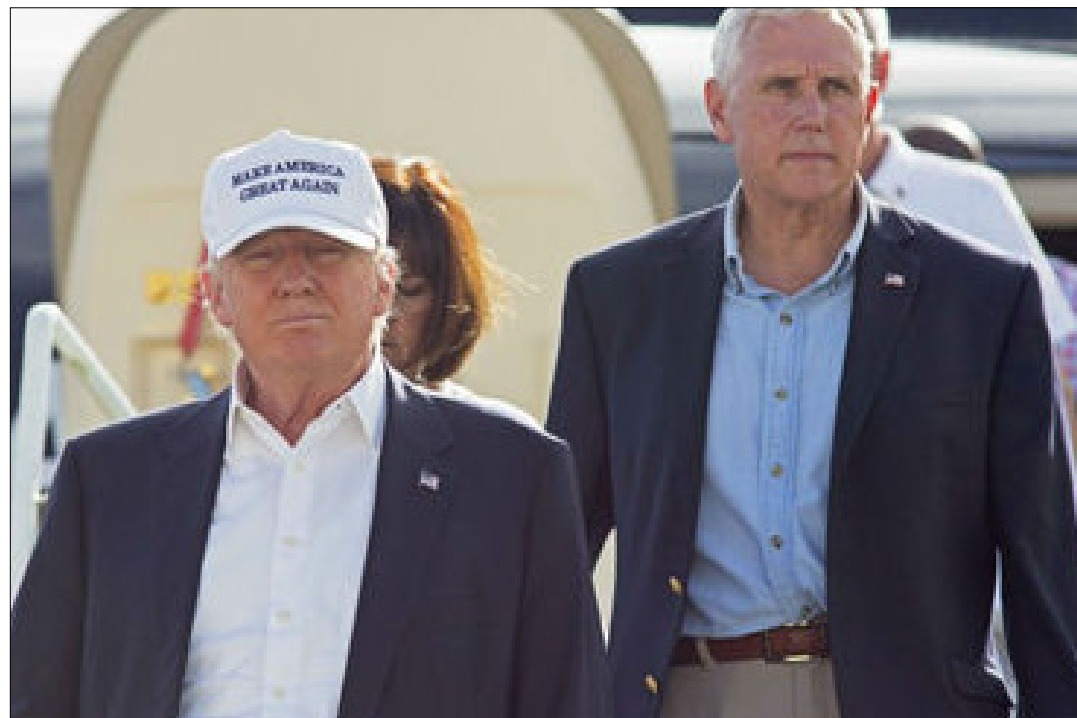
JALISCO.- El vicepresidente electo Mike Pence anticipa "una variedad de maneras" para que México pague por la promesa de Donald Trump.

El programa dominical This Week consultó a Pence sobre la negativa del Gobierno mexicano a pagar por el muro, tema que fue promesa de campaña de Trump. El vicepresidente electo insistió en