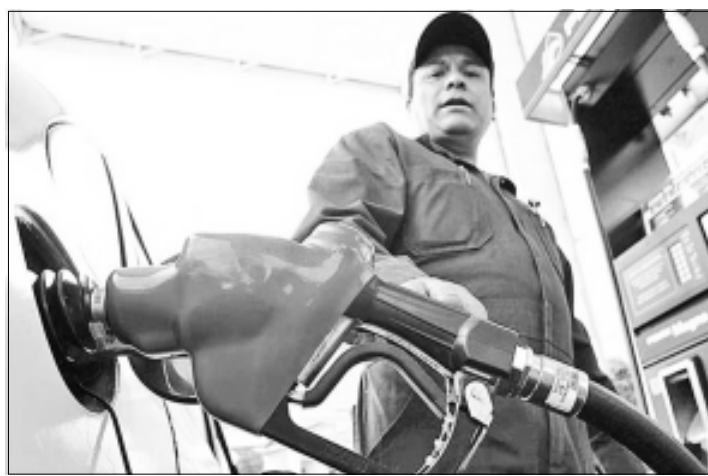
CIUDAD DE MEXICO.- Los aumentos mensuales a los precios de los combustibles permitieron superar la meta estimada en sólo diez meses.

De acuerdo con Estadísticas Oportunas de Finanzas Públicas, elaboradas por la SHCP, la meta anual de recaudación de IEPS aplicado a gasolinas se superó desde septiembre pasado, porque hasta ese mes ya habían ingresado por ese concepto a las arcas públicas 217 mil 919.4 millones de pesos.