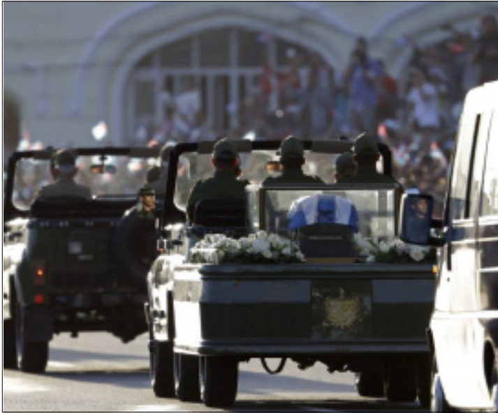
LA HABANA.- Poco antes de las 07:00 horas locales, la urna de cristal cubierta por la bandera cubana, nicho que guarda los restos del invicto Comandante en Jefe partió rumbo a la llamada "Ciudad Héroe".

Los restos de Fidel Castro serán depositados muy cerca de los de José Martí, héroe de la Independencia de Cuba en el siglo XIX, en el Mausoleo a su memoria.