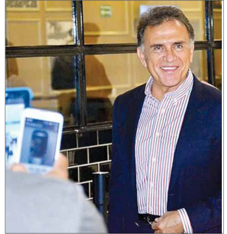
CIUDAD DE MEXICO.- Con información proporcionada por el gobierno electo de la entidad federativa, se conoció el esquema de prestanombres y dispersión de fondos públicos.

da por el gobierno electo en Veracruz fue relevante para el desarrollo de las investigaciones, destacó la PGR.