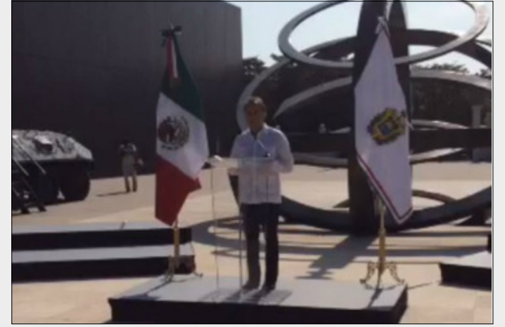
VERACRUZ.- La mayoría de los colaboradores trabajaron al lado de Yunes Linares cuando se desempeñó como Director General del ISSSTE.

En la ceremonia efectuada en el Museo Naval de Veracruz, resaltó la trayectoria de sus colaboradores y aseguró que son de probada honradez y lealtad.