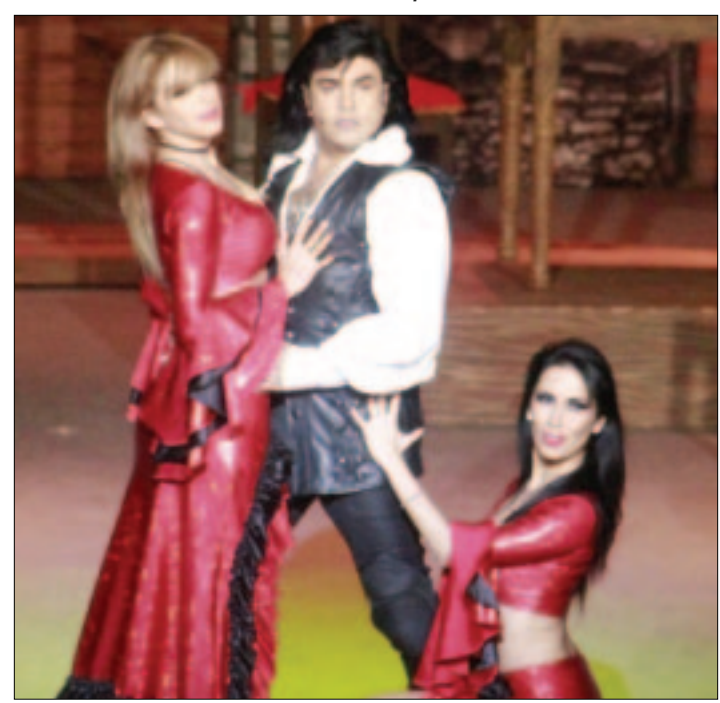
Bellas bailarinas participaron en esta magnífica obra.