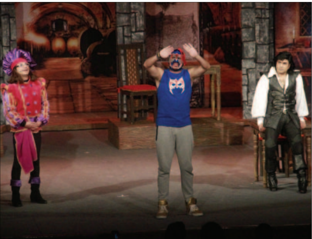
Divertida actuación del «Escorpión Dorado».