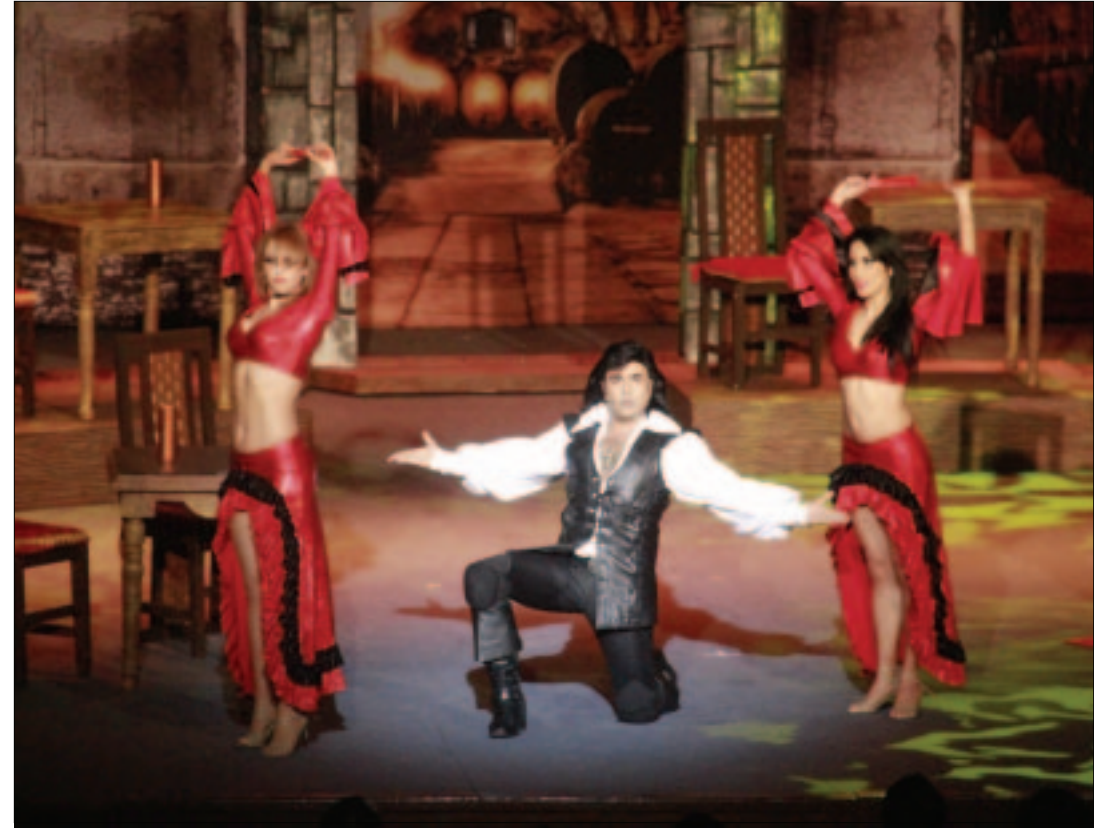
Actuó con su estilo muy característico de «Albertano».