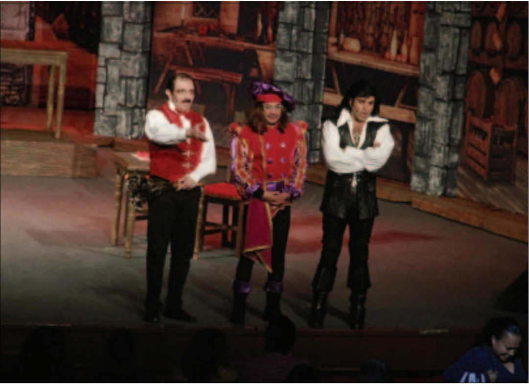
El público asistente disfrutó de albur y buen humor.