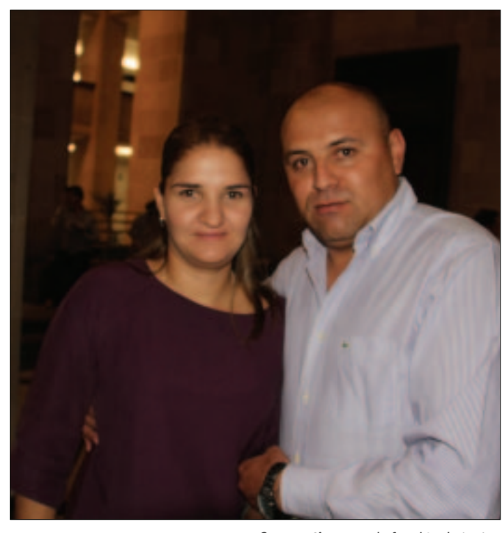
Compartieron en la función de teatro.