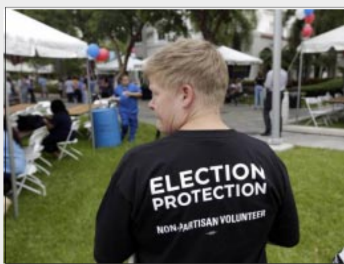
MIAMI.- Una voluntaria de un grupo que invita a los ciudadanos estadounidenses a votar, durante la apertura de las elecciones tempranas en Florida.