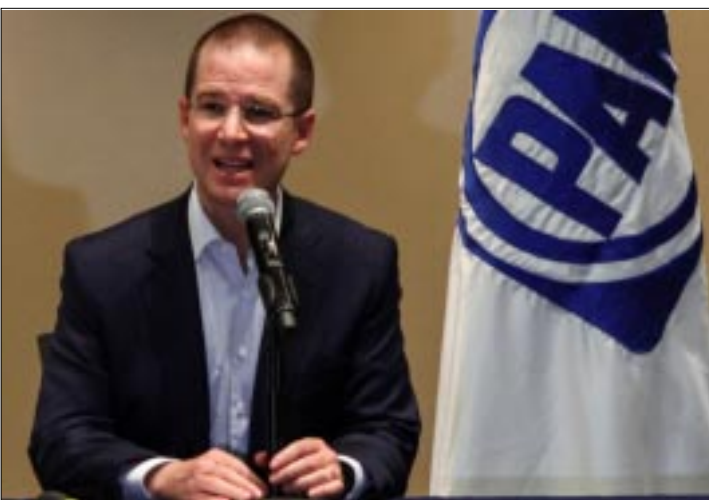
CIUDAD DE MEXICO.- En un comunicado, en el que el CEN presentó su posicionamiento al respecto, el blanquiazul advirtió que la actual dirigencia está concentrada totalmente en sus responsabilidades estatutarias.

Reiteró que «Todo el esfuerzo de los panistas debe estar enfocado a lograr la alternancia en estos estados y continuar el rumbo de la victoria hacia el 2018».