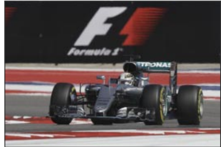
El piloto británico fue el más rápido en la sesión de clasificación del Gran Premio de Estados Unidos.