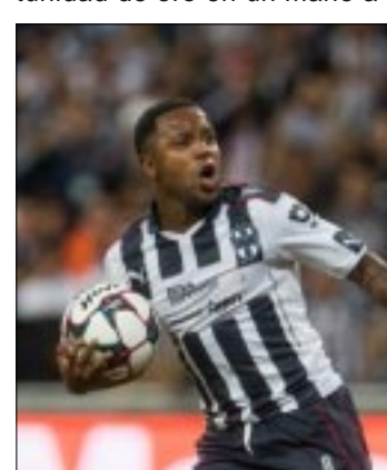
Monterrey y los Diablos Rojos igualaron 1-1 y los regios aún se pueden meterse a zona de Liguilla.

Conforme fueron avanzando los minutos, los Rayados seguían presionando a los Diablos Rojos y poco a poco generaban jugadas de peligro en el área. Al 68' otra vez Funes Mori tuvo una oportunidad de oro en un mano a