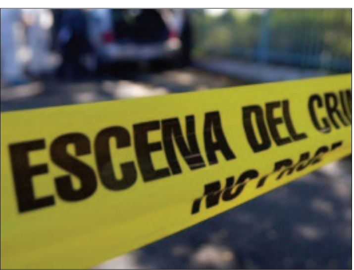
CIUDAD DE MEXICO.- En los últimos meses se han registrado 14 homicidios de miembros de la Iglesia Católica; el más reciente, el de un sacerdote en Michoacán.

Lo más reciente y digno de toda preocupación es el caso de Veracruz y Michoacán, el dato que yo tengo es el de aproximadamente 14 casos, yo quisiera pensar que no son más», comentó el subsecretario.