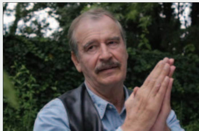
CIUDAD DE MEXICO.- El expresidente de México estuvo publicando sus puntos de vista a través de Twitter durante la presentación de los candidatos estadounidenses.

racional, es inteligente y tiene la experiencia necesaria que todo aspirante necesita. Ella tiene lo que todos necesitamos para «llevar el chivo a casa», mencionó. Fox Quesada aclaró que lo que Estados Unidos y el mundo «menos» necesitan —tomando en cuenta la relevancia y el peso internacional del que es acreedor el vecino del norte— es a un 'violento en la dirigencia' de dicho país. 'Todos mis puntos los estuve publicando en Twitter, con el beneficio de instantaneidad que las redes sociales proveen.