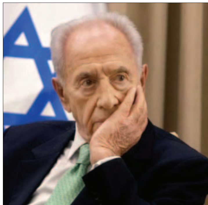
TEL AVIV.- El Nobel de la Paz y figura histórica de Israel había sido hospitalizado luego de sufrir un derrame hace dos semanas.

«Los doctores nos dijeron que su condición es grave y se está deteriorando y todos estamos rezando. Estamos acostumbrados a ver a un