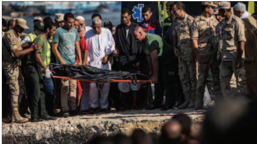
EL CAIRO.- Se espera que la cifra de muertos aumente, ya que se cree que hay muchos cuerpos atrapados en el refrigerador de la embarcación.

Se cree que el barco ha quedado a 15 metros (49 pies) de profundidad, a unos