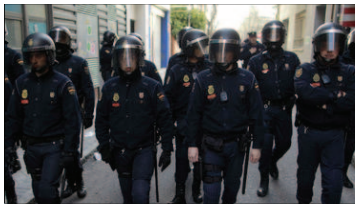
MADRID.- Los arrestos ocurrieron en Valladolid y Murcia.

El segundo detenido, según la versión oficial, «fue la persona de confianza que le ayudó en sus preparativos para viajar a la zona de conflicto y le tuteló tras su detención y retorno a España».