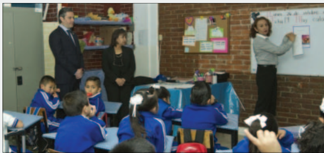
CIUDAD DE MEXICO.- El titular de la SEP advierte que el Gobierno no cederá a la petición de la CNTE.

forma educativa) cancela la oportunidad de sacar adelante a México en el siglo XXI", expuso. Resaltó que por la naturaleza de la reforma, es lógico que existan resistencias porque se cortó la posibilidad de seguir con la venta y compra de plazas magisteriales, entre otros. "Quienes vendían y compraban plazas no quieren perder ese privilegio", señaló. Hizo referencia a que el Gobierno federal mantiene una apertura al diálogo con la Coordinadora Nacional de Trabajadores de la Educación (CNTE) pero no puede llevarse a cabo.