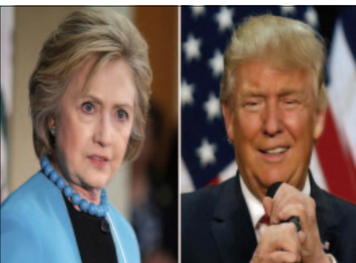
ESTADOS UNIDOS.- Según una encuesta realizada por Reuters con Ipsos, un 45% de los votantes apoyaban a la demócrata, mientras que un 33% lo respaldaba al republicano.

Clinton, ex secretaria de Estado del país, ha aventajado a Trump la mayor parte de la campaña este año. Pero su última diferencia representa un nivel de respaldo más fuerte del que indicaron los sondeos en las últimas semanas.