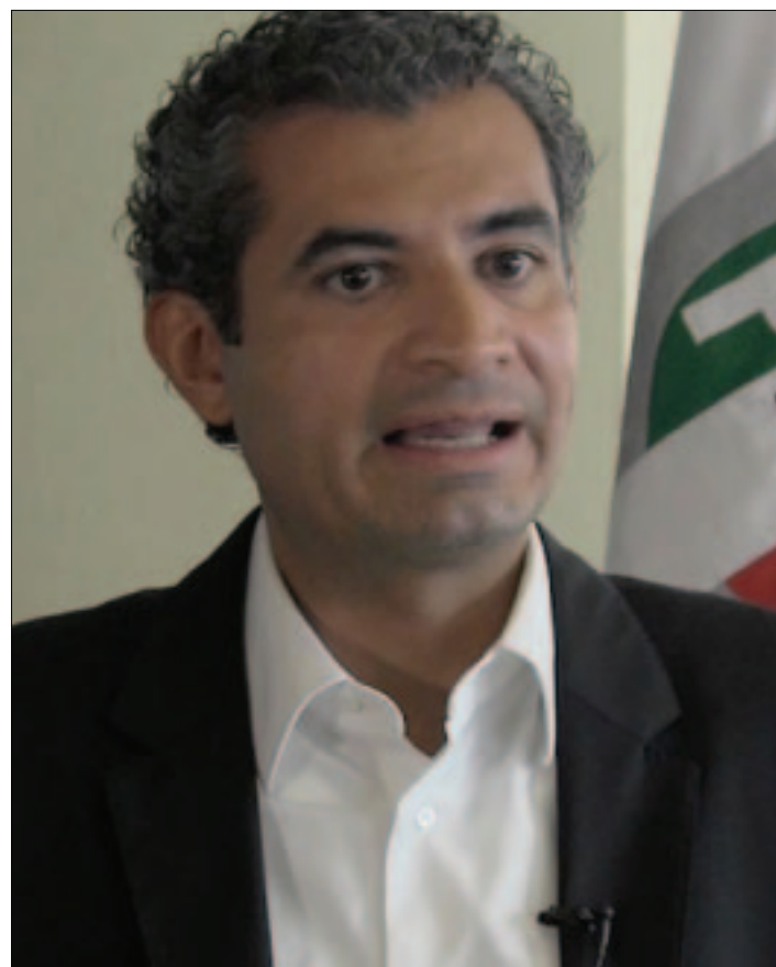
CIUDAD DE MEXICO.- Enrique Ochoa Reza se dice convencido de que el partido debe cambiar y rendir cuentas.

Asegura que ganará las cuatro elecciones de 2017. Para 2018, expone, todavía es muy temprano para apostarle a candidatos.