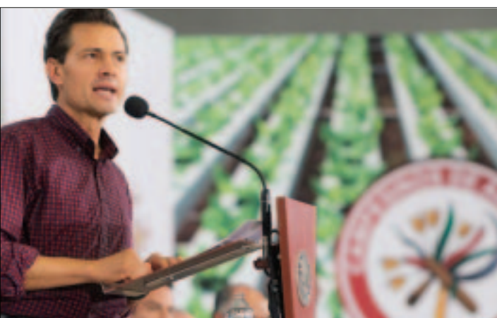
CIUDAD DE MEXICO.- El Presidente reiteró que no se puede hacer rehenes a niños y niñas y a la juventud mexicana de una causa, de una gestión, de una petición.

Peña Nieto subrayó que su gobierno "invariablemente ha mostrado toda la disposición, pero también ha mostrado el firme compromiso de lo que es central y fundamental en esta tarea, que es asegurar la calidad en la educación".