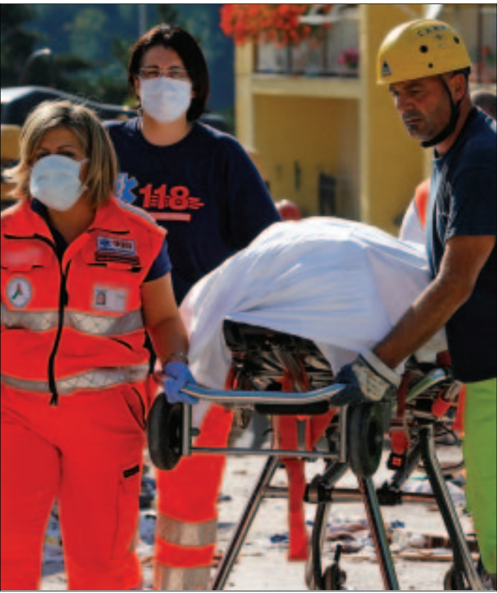
CIUDAD DE MEXICO.- La comunidad internacional expresa sus condolencias y ofrece ayuda al pueblo italiano tras el terremoto que devastó el centro del país.

Por otra parte, el comisario europeo de gestión de desastres señaló que Roma pidió imágenes captadas por satélite de las zonas afectadas por el sismo mientras intenta evaluar la magnitud de los daños.