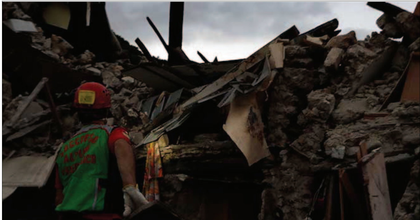
ROMA.- Se espera que la cifra de fallecidos siga creciendo debido a las decenas de desaparecidos.

fue completamente destruida. Otras 59 personas perdieron la vida en las localidades de la provincia de Ascoli, sobre todo en los pueblos de Arquata de Tronto y Pescara de Tronto.