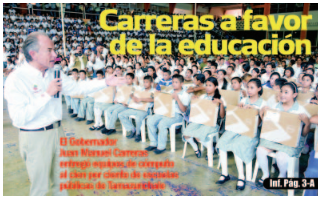
El Gobernador Juan Manuel Carreras entregó espaldas de cemento al cien por ciento de escuelas públicas de Tamasunchale

De momento se desconoce más información sobre la persona, así como si resultó lesionado de consideración, de si se encuentra en una clínica o en su casa.