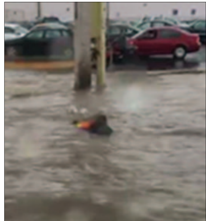
Fue rescatado antes de ser arrollado por un autobús urbano, por cinco personas de la corriente, ocasionada por la lluvias.

tos de peculado, ejercicio indebido de las funciones públicas y uso de objetos, documento falso o alterado en agravio del Ayuntamiento de San Luis Potosí.