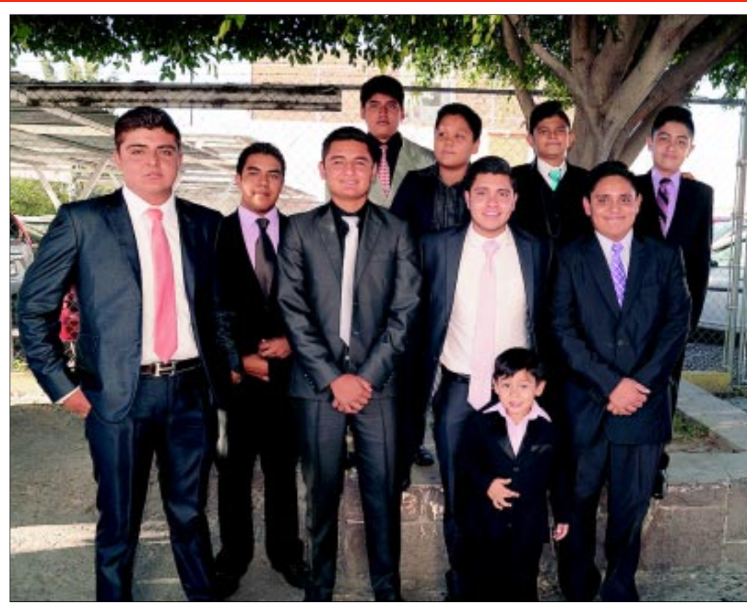
Hermano y primos de la quinceañera le desearon lo mejor.