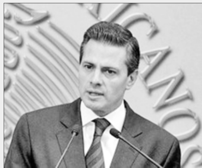
MÉXICO.- Subrayó que Pemex es y seguirá siendo patrimonio de todos los mexicanos.

Indicó que con la expropiación petrolera de 1938 y la creación de PEMEX, México pudo transformar su sector energético pero 75 años después las condiciones de la economía del mundo son totalmente distintas y el esquema energético nacional se había rezagado.