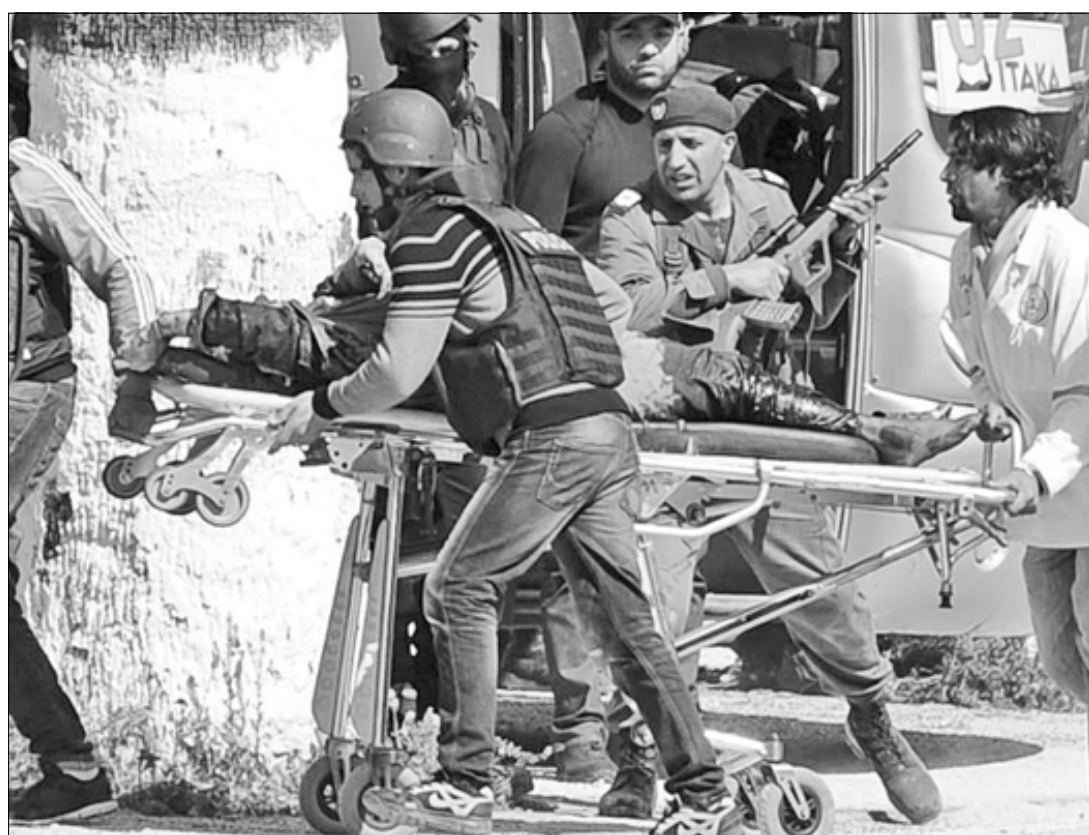
TUNEZ.- Los terroristas intentaron asaltar el Parlamento, pero fueron repelidos. Por ello se refugiaron en un museo cercano donde tomaron varios rehenes.

Recordó que hace 67 años México fue parte de la creación de la OEA, al que tiene «como un organismo hemisférico de excelencia», pero ahora «en un entorno plural y lleno de desafíos» se quiere que sea más «eficaz, que apoye los esfuerzos en aras del desarrollo», por lo que es necesario renovarlo y actualizarlo.