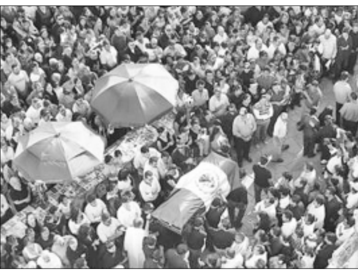
MEXICO.- En el periodo que va de 2005 a 2015 también fueron asesinados en el centro político del país nueve poblanos, siete morelenses, cuatro hidalguenses y un capitalino.

Explosiones en iglesias de Pakistán: 15 muertos Inf. Pág. 4-B