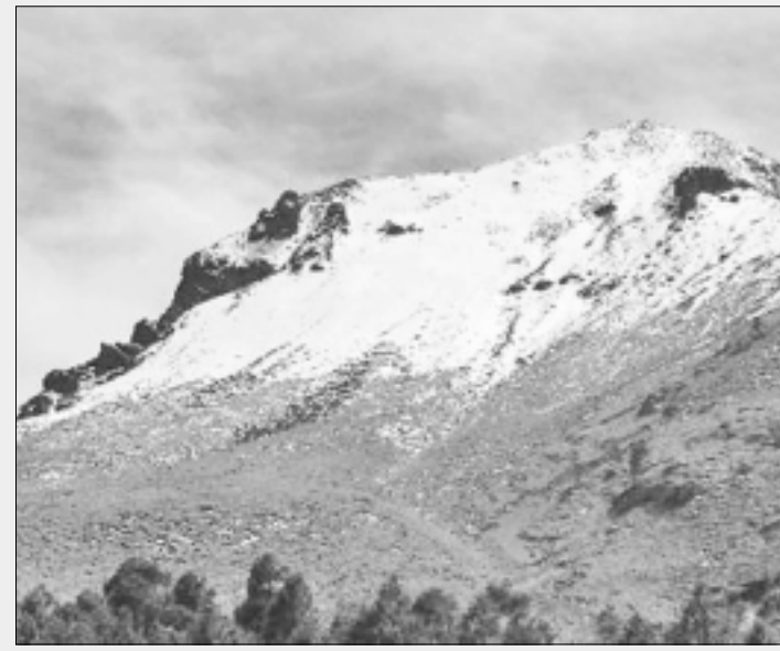
TLAXCALA.- Las nevadas se registraron en el volcán la Malinche, montaña de más de 4 mil 400 metros de altitud.

En el caso de la ciudad de Apatzingán, hasta ahora, las lluvias sólo han causado daños materiales en casas, derribo de árboles, postes de luz y techos que han provocado accidentes viales, sin que hasta el momento se hayan reportado personas lesionadas.