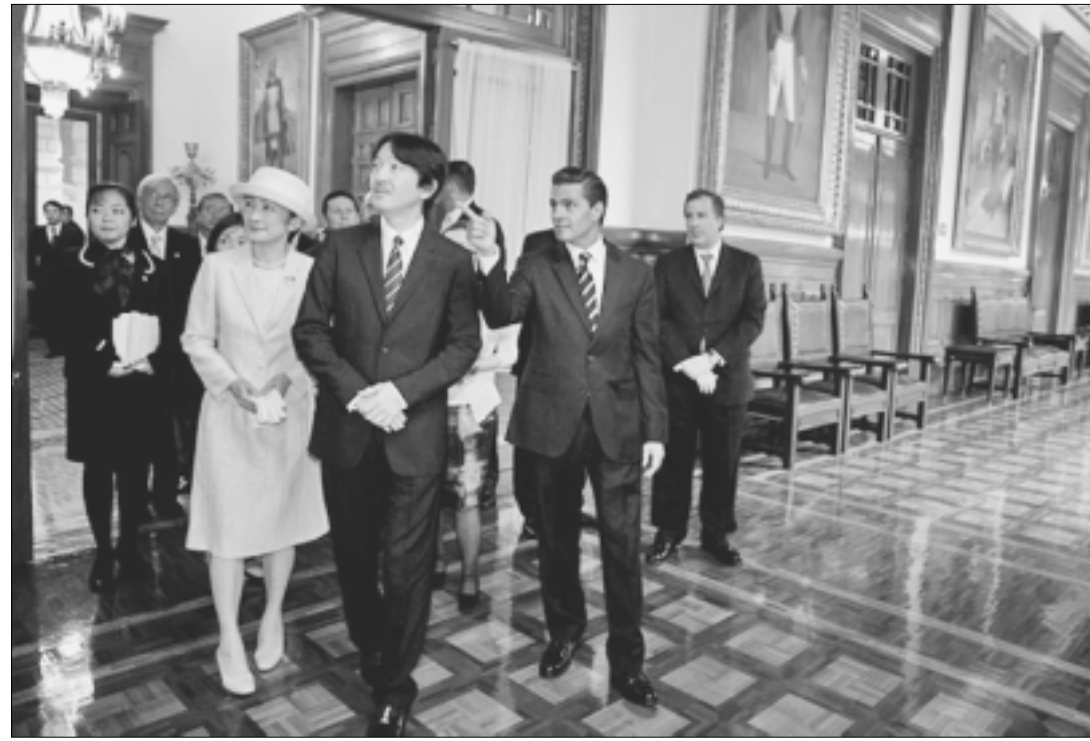
MEXICO.- El Mandatario recibe en visita oficial a los príncipes imperiales de Japón.

Gil Zuarth defendió que en la pasada administración hubo miles de caso que promovió la PGR.