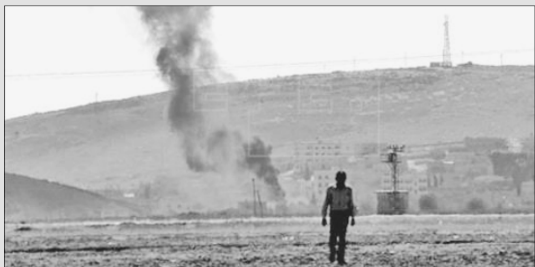
WASHINGTON.- La fuerza aérea utilizó aviones de combate y aeronaves no tripuladas para llevar a cabo tres bombardeos en Siria y tres en Irak.

Estados Unidos anunció hace dos semanas el inicio de la ofensiva aérea, junto a otros aliados internacionales, contra los radicales suníes también en suelo sirio.