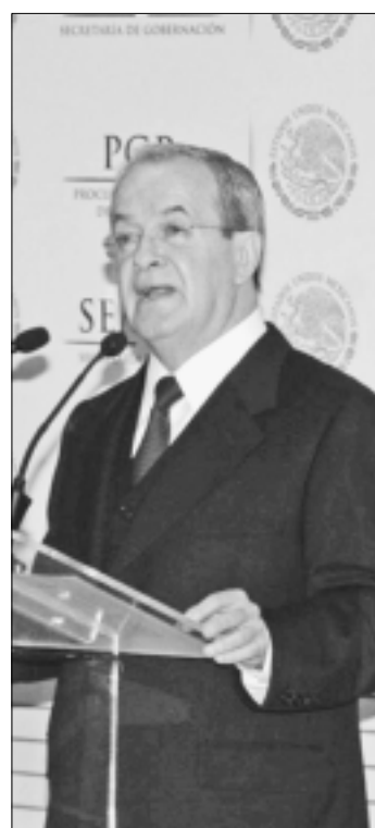
MEXICO.- El comisionado Nacional de Seguridad, Monte Alejandro Rubido.

las acciones de búsqueda de los normalistas desaparecidos y señaló que se actuará con apego a los derechos humanos.