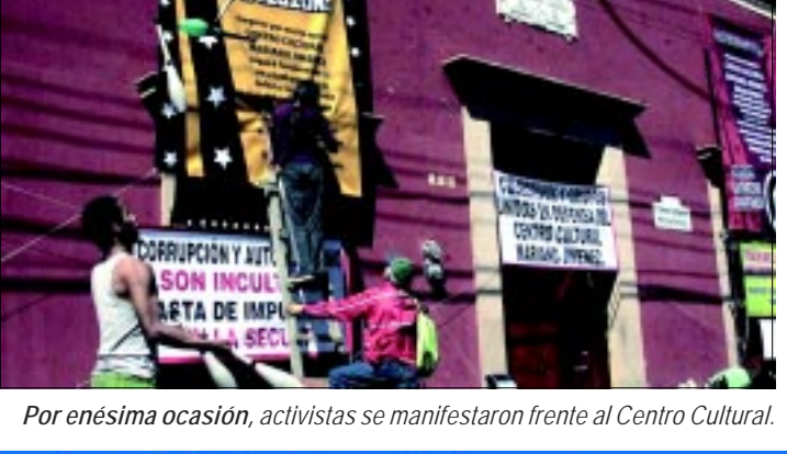
Por enésima ocasión, activistas se manifestaron frente al Centro Cultural.