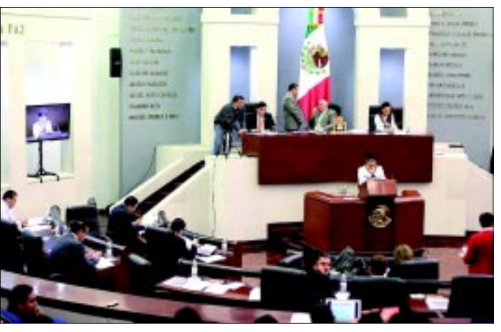
Se incrementa el rechazo a la iniciativa de reformar la citada Ley de Pensiones y de Prestaciones Sociales que es analizada en Comisiones.

Sin embargo, se desconoce en qué forma se recibiría ese beneficio, pues trabajadores del Gobierno del Estado aportan al fondo de pensiones, el cual retiran en el momento en que dejan de prestar sus servicios. Es decir, no se trataría de pensiones vitalicias solamente por el tiempo en que desempeñaron sus funciones.