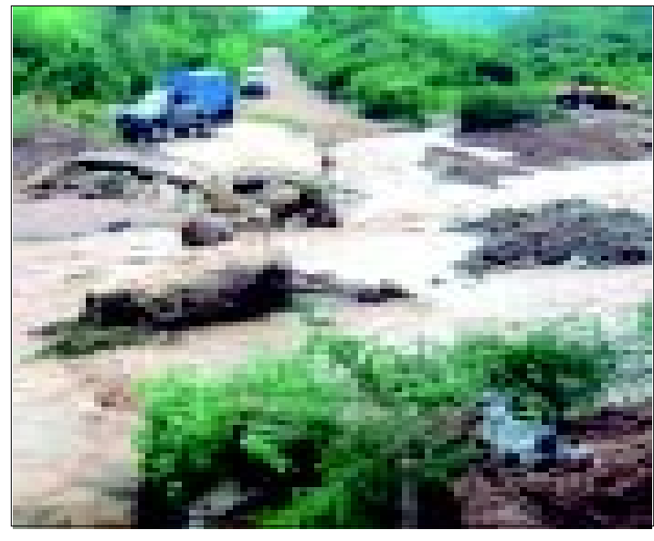
Tocó ahora a los habitantes de Ceritos sufrir las consecuencias de una tromba que se registró la tarde noche del miércoles, dejando ganado muerto y daños materiales.

Falta evaluar los daños ocasionados por el meteoro a los sembradíos de esa zona.