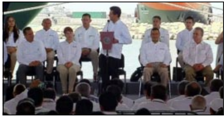
CIUDAD DE MEXICO.- El Jefe del Ejecutivo defendió la implementación de la reforma energética hace dos años.

Y finalizó "tenemos la obligación de convertir a Pemex en sinónimo de eficiencia operativa, solidez financiera e inobjetable transparencia".