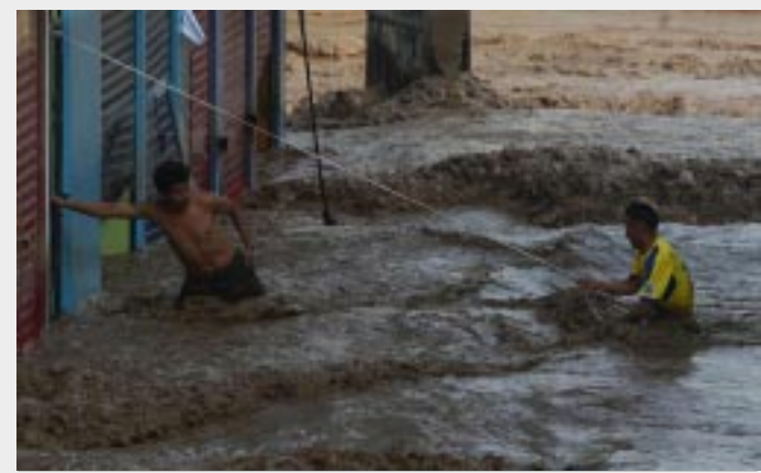
LIMA.-La emergencia climática, asociada al fenómeno El Niño, ha dejado a 70 mil damnificados.

Es importante destacar que la emergencia climática, asociada al fenómeno El Niño, ha dejado a 70 mil damnificados, que lo perdieron todo, y unas 567 mil 551 personas afectadas, que sufrieron daños menores.