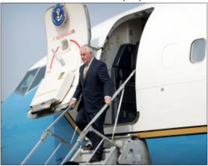
CIUDAD DE MEXICO.-El jefe de la diplomacia estadounidense se reunió con el canciller chino, Wang Yi y otros diplomáticos.

cias entre los dos países sobre cómo manejar la situación de Corea del Norte, un país cada vez más agresivo e impredecible. La primera gira de Tillerson en Asia se produce en medio de las tensiones en la península coreana tras los recientes lanzamientos de misiles de Corea del Norte y ante la posibilidad de que esté preparando otro ensayo nuclear. En Beijing, además de reunirse con su homólogo Wang, Tillerson se entrevistará mañana domingo con el presidente chino Xi Jinping y se espera que exponga el asunto de elevar las sanciones contra las empresas y los bancos que hacen negocios con Pyongyang. "El gobierno de Trump sostiene que las sanciones más duras contra entidades chinas intimidarán a Beijing a cambiar sus políticas", afirmó Ashley Townsend, investigadora del Centro de Estudios de Estados Unidos de la Universidad de Sydney.