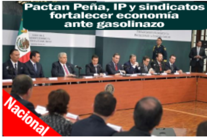
Pactan Peña, IP y sindicatos fortalecer economía ante gasolinazo