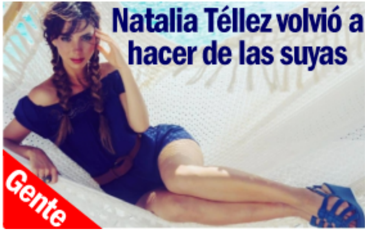
Natalia Téllez volvió a hacer de las suyas