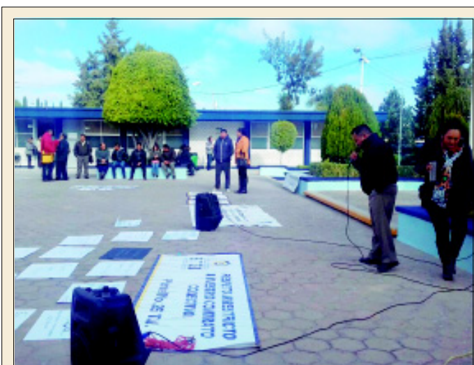
En protesta por la violación al Contrato Colectivo de Trabajo, integrantes del SIT, iniciaron un paro de labores.