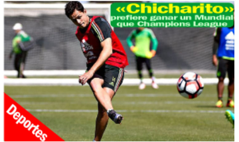
«Chicharito» prefiere ganar un Mundial que Champions League