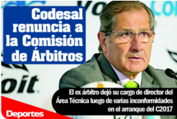
Codesal renuncia a la Comisión de Árbitros

El ex árbitro dejó su cargo de director del Área Técnica luego de varias inconformidades en el arranque del C2017