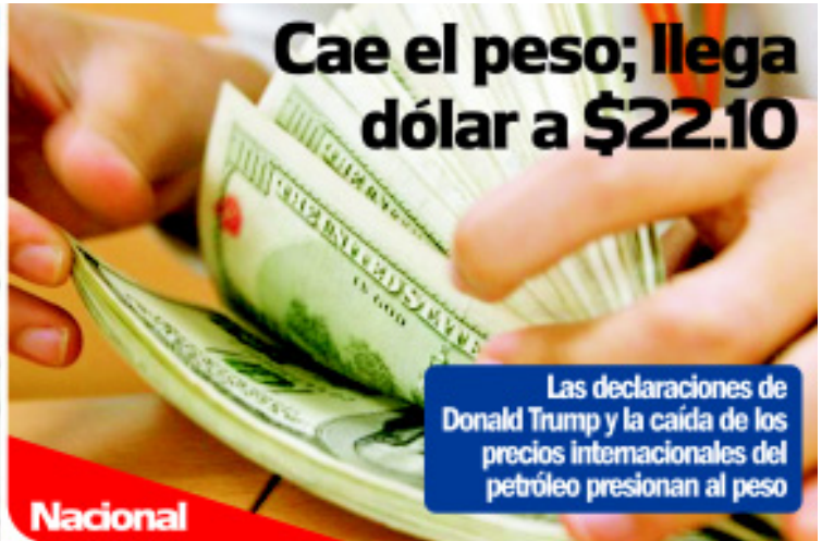
Cae el peso; llega dólar a $22.10

Las declaraciones de Donald Trump y la caída de los precios internacionales del petróleo presionan al peso